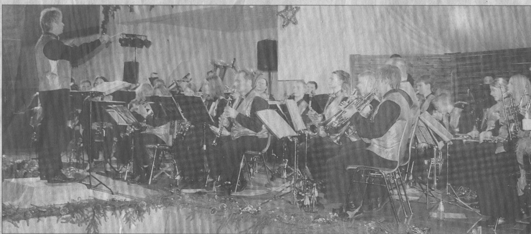
Ein beeindruckendes Weihnachtskonzert bot der Musikverein Geraberg am ersten Weihnachtsfeiertag in der Geratalhalle den mehr als 600 Gästen